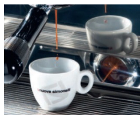
Reverse Mirror zur Kontrolle des Brühvorgangs