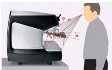
Beste Ergonomie zur einfachen Bedienung des Gerätes