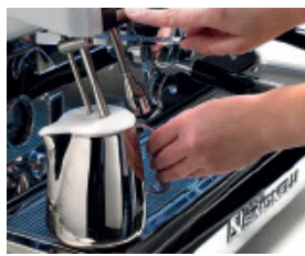
Elektronische Milchzubereitung für kinderleichte Milchschaumproduktion