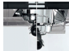
Unterschiedlich hohe Brühgruppen für alle Getränkearten bzw. Tassen / Gläser