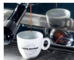
Reverse Mirror zur Kontrolle des Brühvorgangs