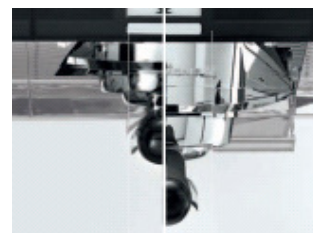
Unterschiedlich hohe Brühgruppen für alle Getränkearten bzw. Tassen / Gläser